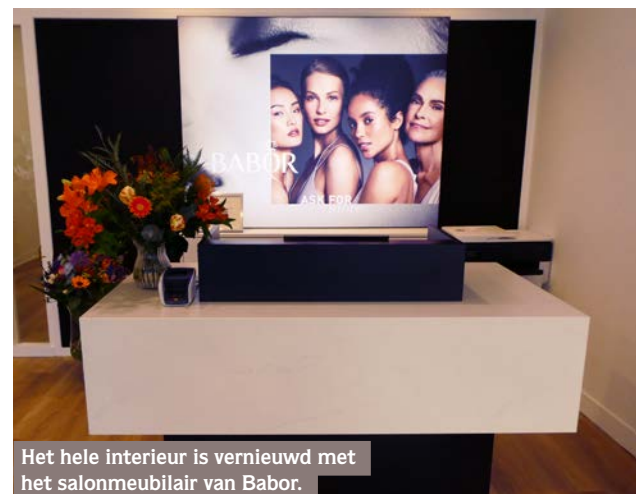
Het hele interieur is vernieuwd met het salonmeubilair van Babor.