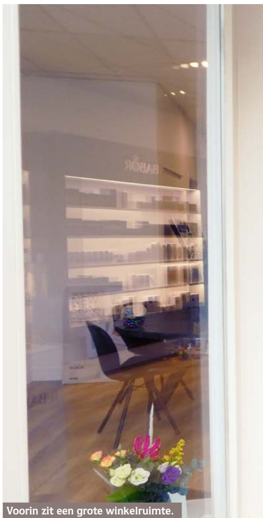
Voorin zit een grote winkelruimte.